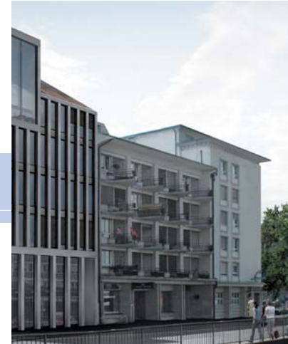
Eingebettet zwischen Hugo Steiner-Haus und Grünanlage.